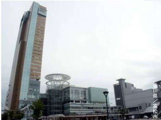
香川県 / 高松市