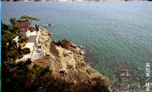
高知県 / 桂浜