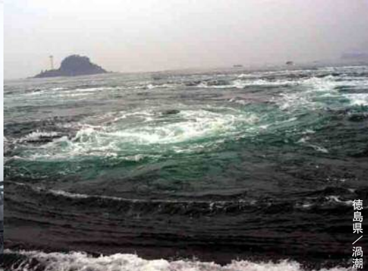
徳島県 / 渦潮