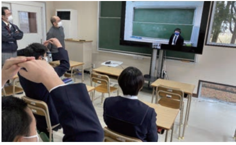
中山間・離島地域の子どもたちにも、都市部と同じ品質の教育を届けるため、有名講師のオンライン出張授業を実施

務所を経営されている先生方にとって、特に使い勝手が良いものではないでしょうか。プライベートの携帯番号やLINEのアカウントを顧問先に教えて、いつ何時でも対応するというスタンスの先生方もいらっしゃると思います。中には就業時間以外の対応は控えたいと思っている方もいらっしゃるはず。その点Zoom Phoneであれば着信可能な時間を設定し、それ以外の時間帯は留守電機能をオンにすることができ、オンラインの切り替えを無理なく行うことができます。その他、Zoom Phoneであれば、会議