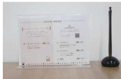
上:新潟オフィスの人員は6年で30名に拡大したそうです 下:来客向けにグループ運営のカフェ「LAND.」のコーヒーなども提供しています

はその後、経営状況の改善に向けてアドバイスをさせていただきました。例えば、それまでは職人がコストを気にするのではなく商品を作っていたのですが、「1個いくらで作れるか」を厳密に計算した上で原材料の量や商品の大きさなどを決めるようにしたり、看板をより人目に付きやすい場所に移動したり、ホームページなどでの情報発信の仕方を工夫したりするなど、かなり具体的に細かいところまで一緒に話し合いながら従来のやり方を変えていったことで、着実に利益率が改善していきま