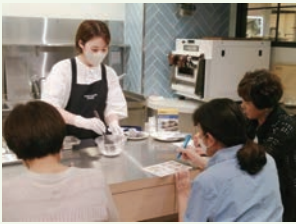
今年7月に同社のキッチンスペースで実施したイベント(水まんじゅう作り)の様子