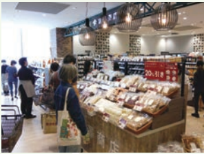
今年4月25日オープンした「星が丘テラス店」(名古屋市の様子)