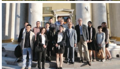
(上)モンゴルの大草原を駆けました (下)訪問者での集合写真です

設立から関与したNPO法人ハートセービングプロジェクト(以下HSP)の理事の小児循環器科の先生方からお誘いを受け、モンゴルに行くことになりました。