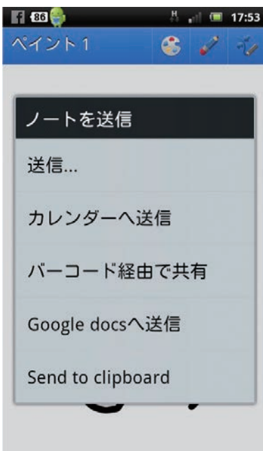
保存したメモはメールで送信したり「Google Docs」として共有できる

「Note Everything」を使えば、スマホのマイクに向かって話した言葉をもメモとして残したり、指先で描いた絵や文字を画像情報として記録できます。保存された音声や画像メモは、メールに添付して所員に送って指示などに活用するだけではなく、