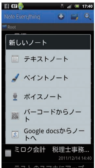
「Note Everything」ではテキストだけではなく音声や手書きの絵もメモとして保存できる

はなく音声や手書きの絵なども、スマホ&タブレットに保存できます。スマホの小さな画面を指で叩いて文字を入れるのが面倒だと思う人でも「Note Everything」を使えば、