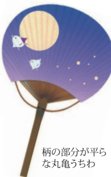
柄の部分が平らな丸亀うちわ

伝統と新しいビジネスモデルを組み合わせながら、さらなる成長を遂げる四国団扇。これからも丸亀の産業界を牽引していきそうな元氣企業だ。