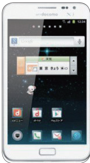
スマホよりも二回り大きくて使いやすいファブレット端末 (高さ147mm×幅83mm×厚さ9.7mm)

これまでの連載を通して、スマホ & タブレットで活用できるアプリ の数々を紹介してきました。アプリ の利便性がわかると、持ち運びに便 利で電話機 としても使 えるスマホ と、画面が 大きくてノ ートPCの 代わりとし ても使える タブレットのどちらを使おうか、迷 ってしまうかもしれません。そこで 今、人気を集めている最新機種が、 「Galaxy Note」に代表さ れるファブレットと呼ばれる端末 です。ファブレットはPhone とTabletを合わせた造語で、 まさにスマホとタブレットの中間 にあたる用途を考えたものです。ス マホよりもサイズが大きいので、画 面の文字も大きく読みやすくなって います。また付属のタッチペンを使