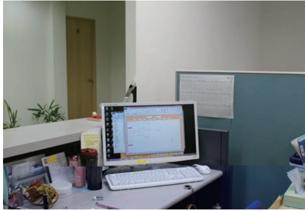
事務所入り口の受付では、業務を行いながら事務所全体のスケジュール確認が行える。

これにより、お互いがどの日に在席しているかがわかるため、打ち合わせなどの日程調整に役立っています。それぞれが独立して仕事をしていても、MJSのスケジュール管理でうまくコミュニケーションが取れているということです。