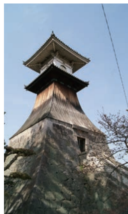
日本最高の木造灯籠

また、この金倉川沿いには高さ28mの日本最高の木造灯籠もあります。瀬戸内を公開する船の指標として建てられ、1860年に完成したといわれています。この威風堂々とした佇まいから、あらためてこのあたりが漁業の町であることを感じ取ることができ