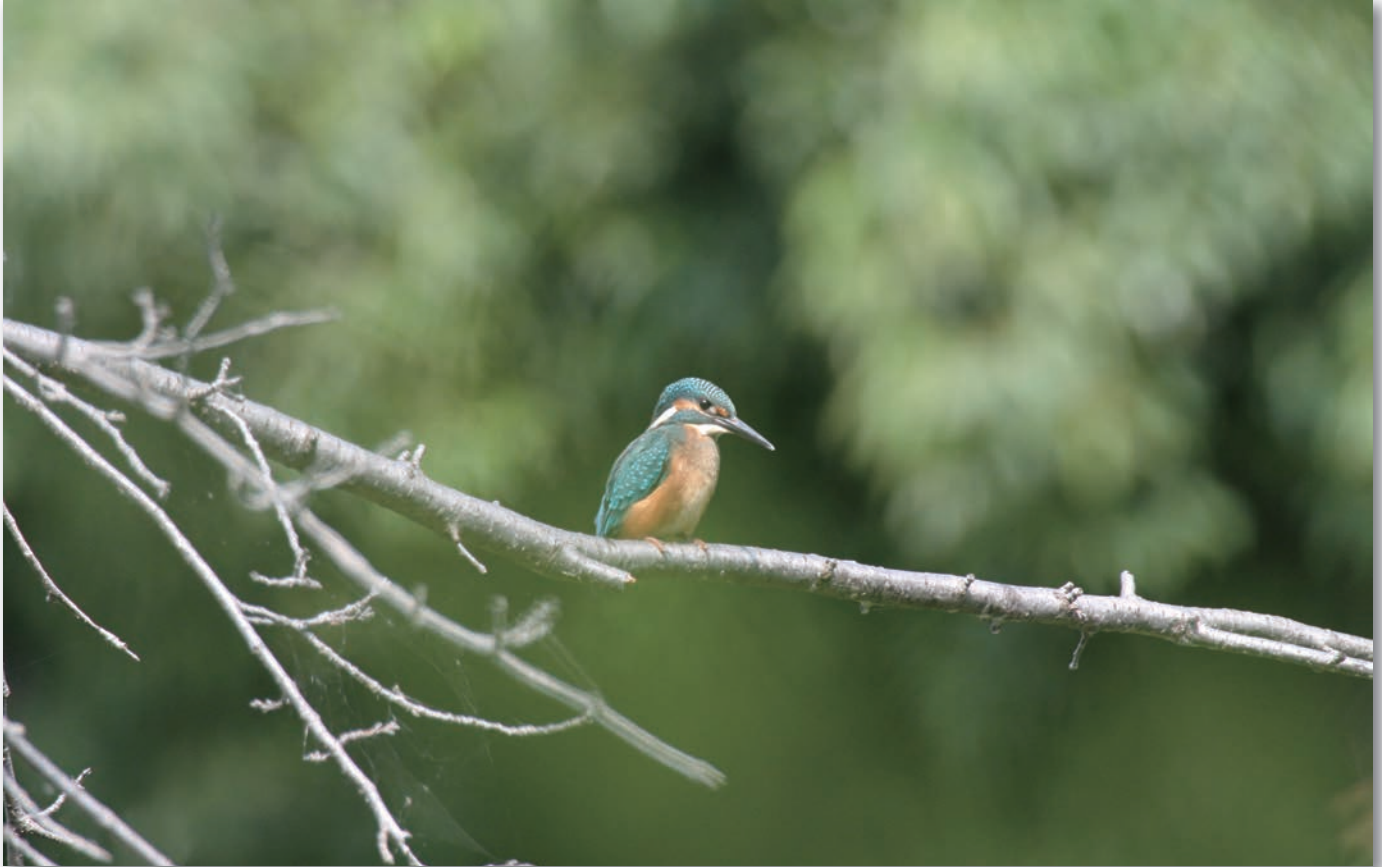
場所：道後公園のカワセミ(愛媛県松山市)