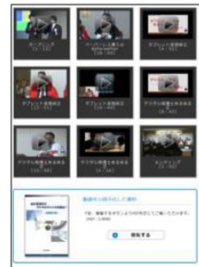
情報ネットワーク委員会の企画・運営 業務改善シリーズ第3弾「これだけでも便利！気軽に使えるタブレット」