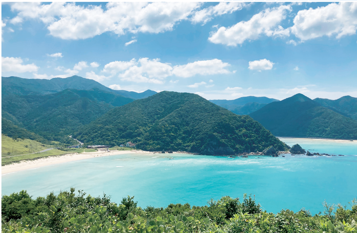
長崎県五島市三井楽町 高浜海水浴場 (長崎地区会 笠戸 智仁)