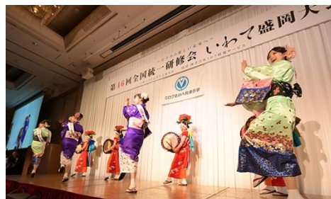
懇親パーティーオープニング「盛岡さんさ踊り」