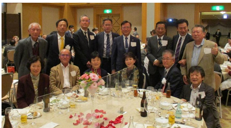
懇親パーティーでの集合写真