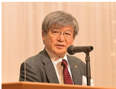
式典での植田連合会会長の挨拶。