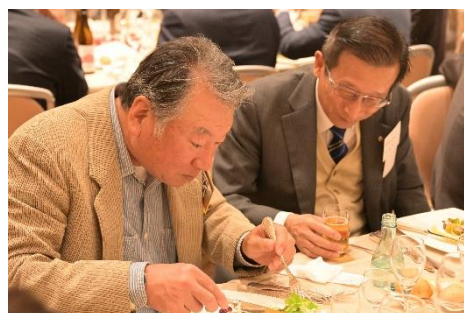
懇親パーティーではオープニングの「盛岡さんさ踊り」から始まり「津軽三味線」の演奏を聞きながら三陸の美味しい料理をいただきました。次回の開催単位会である近畿会の皆様より御参加のお願いのPRがありました。