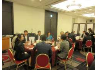
懇親パーティの様