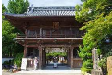
<第1番札所 霊山寺 仁王門>

弘法大師が人間の持つ八十八の煩惱をなくそうと、四国に霊場を開こうと決意しこの場を訪れ、その際、老師を囲んで熱心に法を聞いている光景を目にし、その様子が釈迦如来がインドの霊鷲山で説法していた様子にあまりにも似ていたことから霊山寺と名付けられた。 四国巡礼の第一歩を踏み出す第1番札所のため、発願の寺、一番さんなどと親しまれている。境内には男女の縁、健康との縁、幸せ、仕事との縁など様々な縁の結びつきにご利益のある縁結び観音や、タヌキの姿もかわいい火災除けの札などが有名。 近くには日本で初めてペーターベンの第九交響曲が演奏された坂東俘虜収容所を偲ぶ遺構も存在するので、少しだけ足を伸ばしてみるのも一興か。