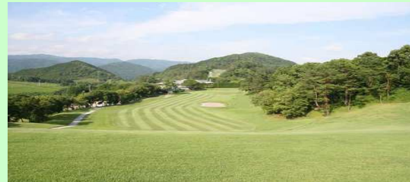
錦山カントリークラブ

高知地区のゴルフコンペにおいても若手税理士の台頭は目覚ましく(ベテラン組の衰退が激しいのかもしれませんが...)ドラゴン賞はもとより、ニアピン、パスグロ、上位入賞まで彼らが総取りの様相を呈していましたが、唯一優勝のみは、元ミロク会計人会 高知地区会長のベテラン税理士が獲得し、一同ほっとした次第でありました。