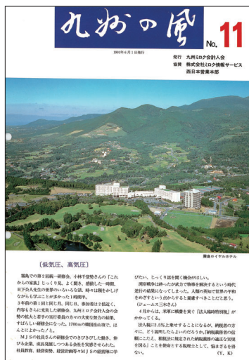
九州の風 11号 (平成33年6月発行)