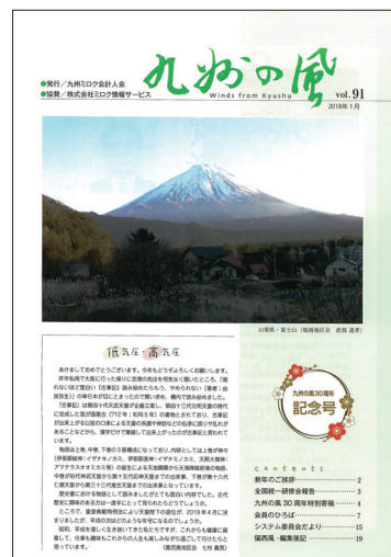
九州の風91号(平成30年1月発行)