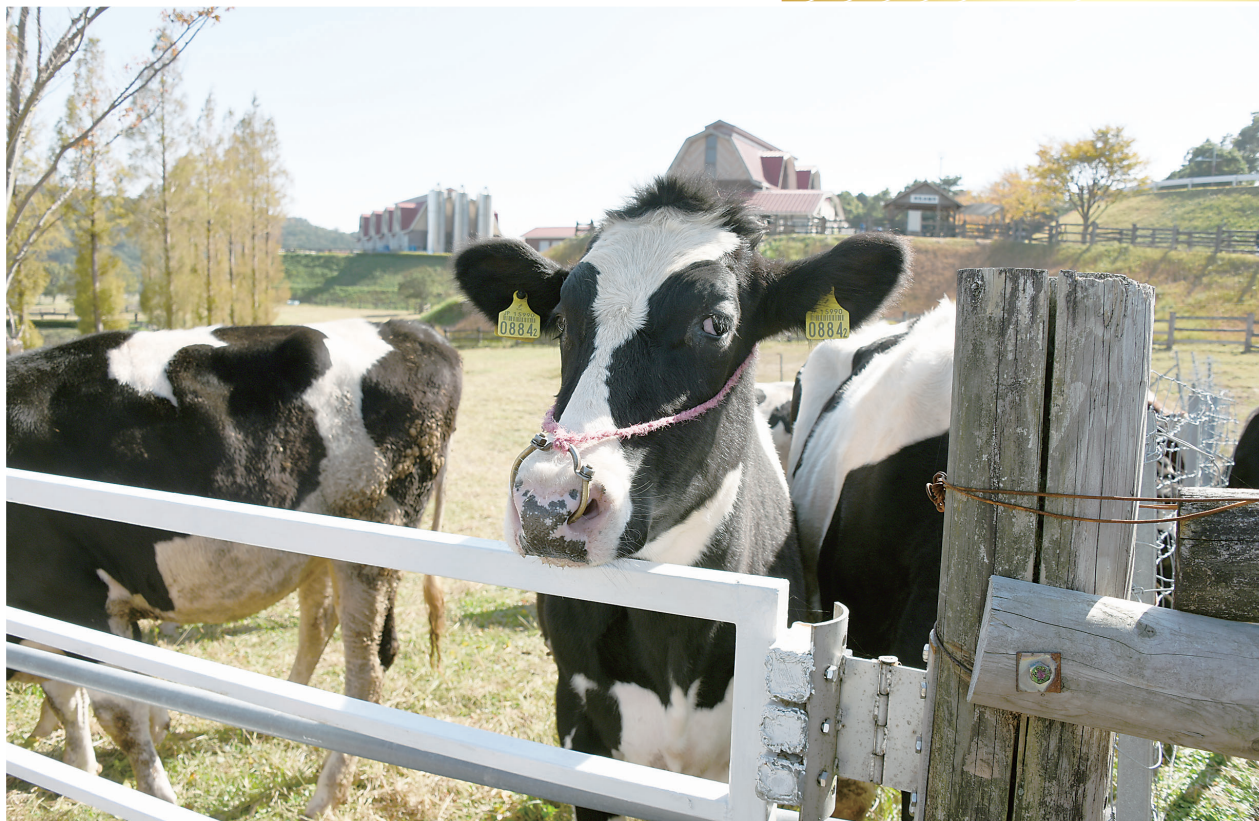
丑年に因んで、福岡の「もーもーらんど」で撮影 (福岡地区会 船越 久人)