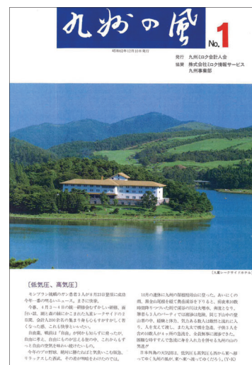
九州の風1号(昭和62年12月発行)