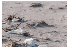
ブラゴミと呼ばれる発泡スチロール、ペットボトル、レジ袋などのゴミを減らすことが課題となっている