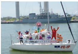
「タモリカップ」富山大会のヨットパレードでベストパフォーマンス賞を獲得した花子チーム。パレードとヨットレースは誰でも観覧できる