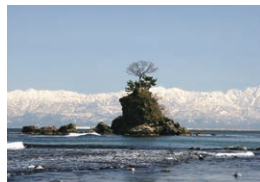
雨晴(あまはらし)海岸。高岡市北部の海岸で海越しの立山が見える絶景ポイント。能登半島国定公園に指定されている