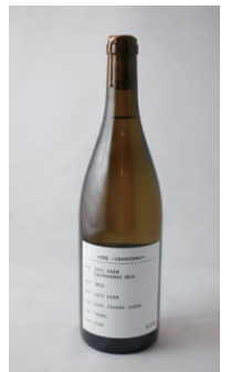
看板商品の「シャルドネ」