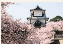
「金沢城・石川門と桜」 (石川県金沢市)

金沢城公園の入口となっている石川門は、城の東に位置する重要文化財です。宝暦9年(1759)の大火によって全焼しましたが、天明8年(1788)に再建され、その後修理を重ねて現在の姿になりました。豊かな緑の中、百万石の風格を漂わせるその堂々たる構えが印象的です。桜の開花時期には多くの方が花見に訪れ、夜にはライトアップされた夜桜を楽しむことができます。(舟野 喜代子)