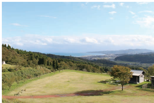
富山湾を望む抜群のロケーション