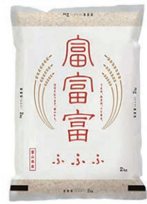
昨年のデビュー以降、人気が高まっている「富富富」です

一方、18年秋、いよいよ富山米の新品種である「富富富」がデビューしました。「ふふふ」と読み、ごはんを食べた人に「ふふふ」と微笑んで、幸せな気持ちになってもらいたいという想いも込めて名付けられたとか。 粒ぞろいが多いので、炊きあがったごはんはつややかで透明感があり、口に入れると甘み・旨みが広がりますし、冷めてもおいしいと販売も好調なようです。