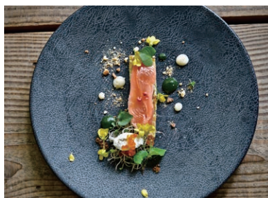
食材にこだわり、ワインとの相性を追求した料理を提供。写真は桜鱈のコンフィ

え付けてあるので、町で氷見の食材を購入し、調理しながら楽しんでいただくこともできます。宿泊可能人数は合計6人で、ご夫婦やご家族、グループで宿泊される方たちが多いです。 梶 収穫祭も実施されていますね。