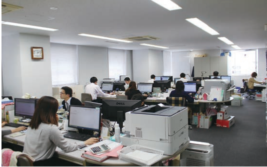
新体制になり、広域法人の本部機能を担う金沢事務所

課題は多々ありますが、なかでも少子高齢化、人口減少が深刻です。私たち税理士の関与先の大多数を占める中小企業・小規模事業者数は、90年代初頭には480万ほどだったのが、2016年頃には380万にまで減少してしまいました。経営者のボリュームゾーンはいまや60代後半となっており、この先5年、10年で団塊の世代が一斉に引退していきます。その数は百数十万社以上とも言われ、そのうち後継者が決まっている企業は半分以上であり、当然、企業数は激減するでしょう。税理士業界にとって、そして日本経済にとって由々しき事態を少しでも食い止めるために、いかに事業承継をスムーズに行うかが喫緊の課題とな