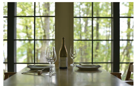
レストランのテーブルからは緑豊かな景色が楽しめる