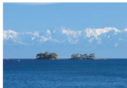
氷見市沖合1kmにある富山県最大の無人島、蛇ヶ島(あぶがしま)から望む立山連峰