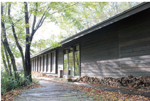
レストランとショップを兼ねた建物の外観

飯田 シャルドネやソーヴィニオン・ブラン、メルロー、カベルネ・ソーヴィニオンなどを栽培し、それぞれの名を冠したワインを造っています。看板商品は「シャルドネ」と「オジコシヤ